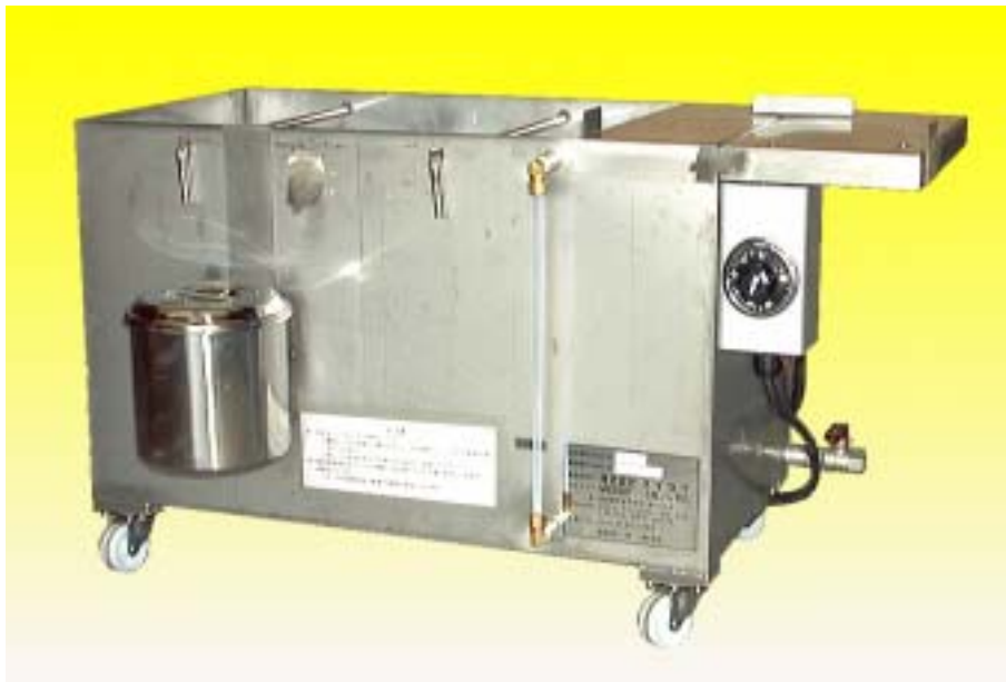
【粘度コントローラーをセットした場合】

一斗缶に入れたパートコート液や接着剤を温水で保温します。 自動温度調整器が水温が下がると電熱ヒーターを加熱して一定水温に保ちます。 保温タンクには、一斗缶が2本入り予備用の缶も保温できます。 粘度コントローラーを併用すれば粘度と液温を自動制御できます。 移動の時に便利な車輪と粘コンの吸入口、吐出口を入れる収納タンクが付属しています。