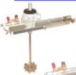
VF - 03K - 3045型