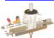
VF - 03K型