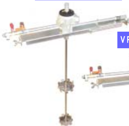
VF - 03D - 4560型